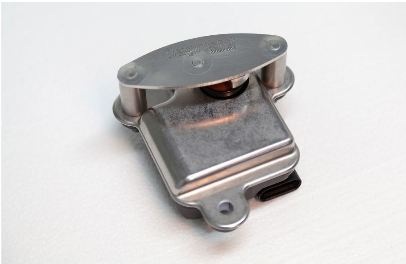
Endlagenplatte aufstecken. / Put on the bracket plate.