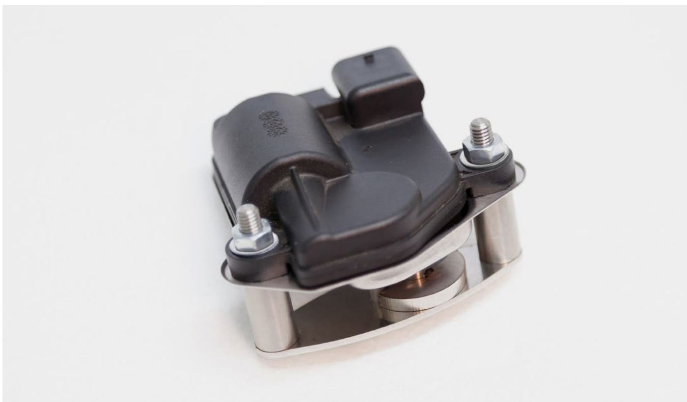
Mit Unterlegscheiben und Muttern sichern. / Secure with washers and nuts.